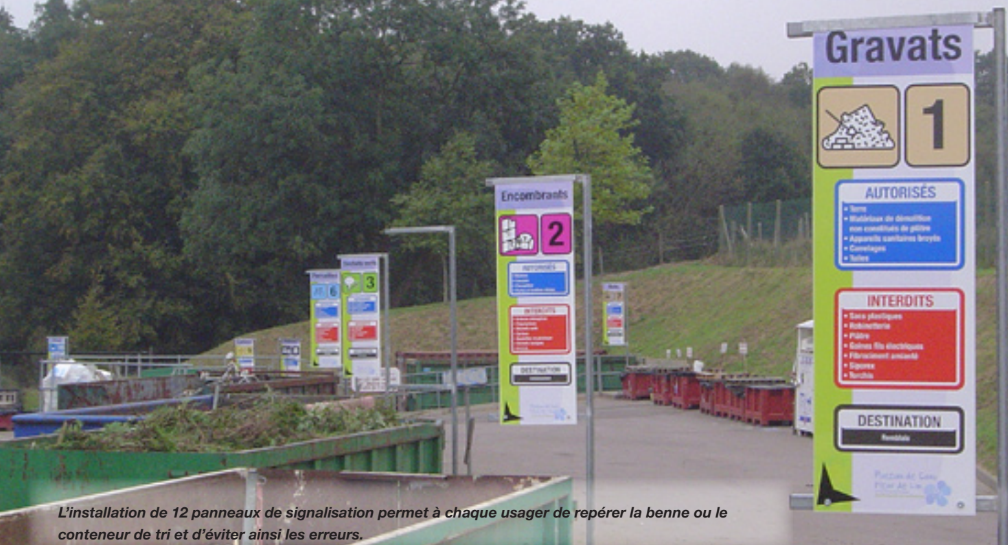
L'installation de 12 panneaux de signalisation permet à chaque usager de repérer la benne ou le conteneur de tri et d'éviter ainsi les erreurs.