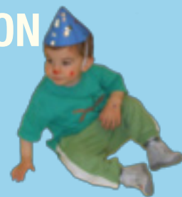
Déguisés, ils se sont bien amusés !

et aux cabrioles des chevaux. Le goûter a été le bienvenu avant de repartir vers Doudeville les yeux pleins d'étoiles.