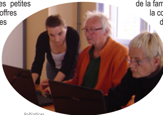
Initiation à l'informatique

Un tableau d'affichage, situé à l'accueil de la Communauté de Communes, vous permet de déposer ou de consulter des petites annonces (offres et demandes d'emplois, ventes...). N'hésitez pas à venir y déposer la votre.