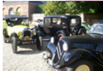
De belles voitures anciennes dans un cadre agréable

Parking gratuit Entrée : 1€ pour les plus de 12 ans.